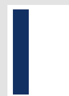
■ 1/3 Seite hoch 57 x 265 mm