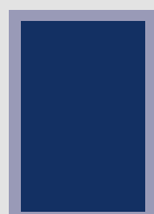
■ 1/1 Seite 210 x 297 mm ■ 1/1 Seite 178 x 265 mm