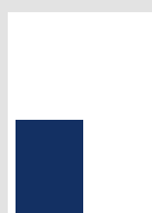
■ 1/4 Seite hoch 87 x 130 mm