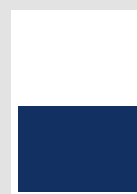
■ 1/2 Seite quer 178 x 130 mm