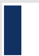
■ 1/2 Seite hoch 87 x 265 mm